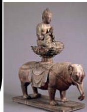
国宝 普賢菩薩騎象像

平安時代から近代までの日本美術の王道をしめす作品のラインナップで私は国宝古今和歌集序が見れるのを楽しみにしています。