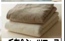
毛布&シーツコース